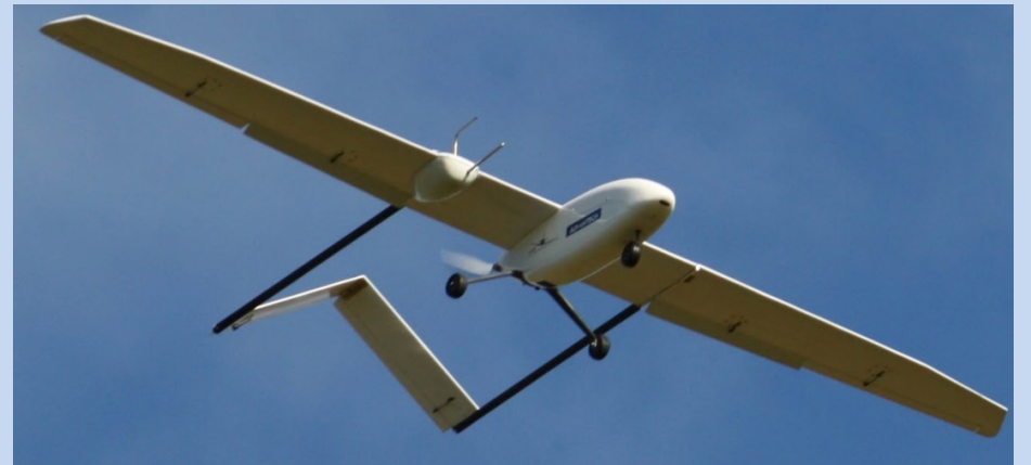
Flugversuchsträger ALEXIS (IFSys)